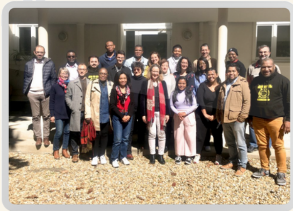
Etudiants de Paris et Montpellier en session commune en 2022

A partir de 19 h 30 : buffet, bavardages et souvenirs avec accompagnement musical